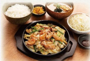
鶏とキャベツの コク旨味噌炒め定食

(6個) 790 円 (8個) 980 円 (税抜:719円) (税抜:891円)