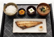
しまほっけ定食(半身)