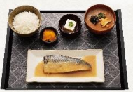
サバの味噌煮定食