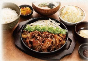
【牛・豚・鶏】焼肉ミックス定食

(並盛) 990 円(倍盛) 1,490 円 (税抜:900円) (税抜:1,355円)