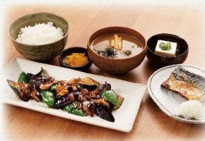
茄子味噌と焼魚の定食

(並盛) 990 円(倍盛) 1,490 円 (税抜:900円) (税抜:1,355円)