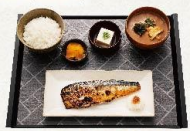
サバの塩焼き定食