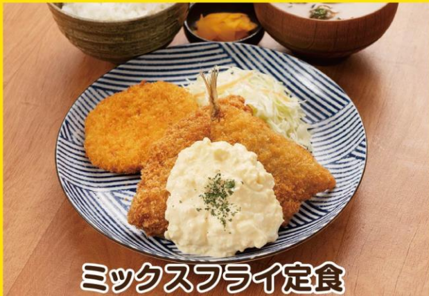
ミックスフライ定食