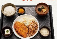
サクサク鶏むね肉の子キン南蛮と 豚バラの生姜焼き定食