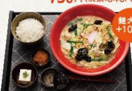
コク旨味噌スープの豚茶麺