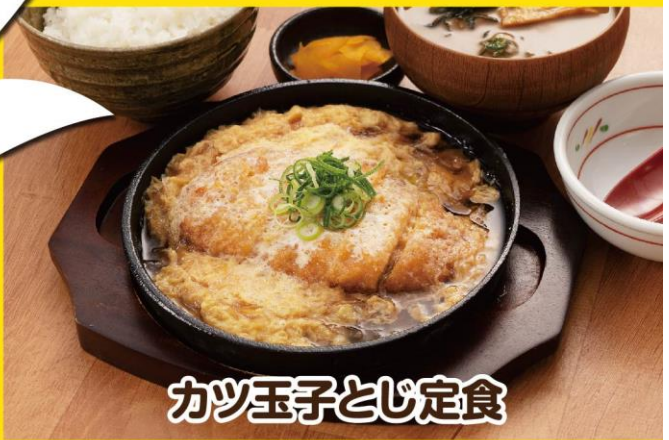
カツ玉子とじ定食