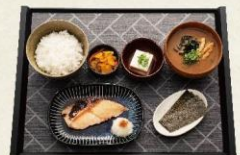
しゃけの塩焼き朝食 590円 (税抜:537円)