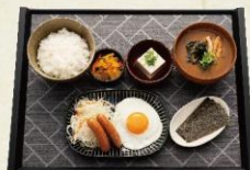
目玉焼きと ウインナー朝食 490円 (税抜:446円)