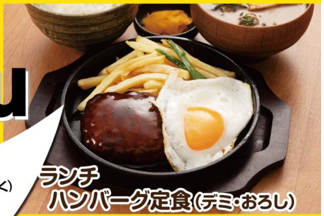
ランチ ハンバーグ定食 (デミ・おろし)