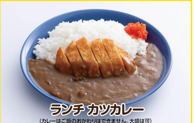
ランチ カツカレー