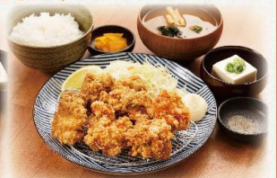
鶏もも肉の唐揚げ定食

(並盛) 790 円 (大盛) 950 円 (税抜:719円) (税抜:864円)