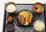
牛カツステーキミックス定食

牛カツ (並盛) (大盛) ステーキ定食 1,490 円 1,900 円 (税抜:910円) (税抜:1355円)(税抜:1728円)