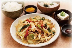
たっぷり肉野菜炒め定食

(4個) 920 円 (5個) 1,040 円 (税抜:837円) (税抜:946円)