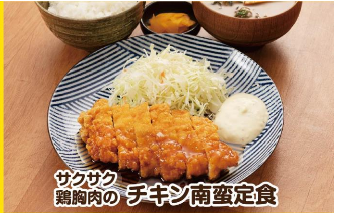
サクサク 鶏胸肉の チキン南蛮定食