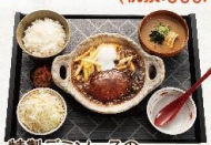
特製デミソースの 煮込みハンバーグ定食