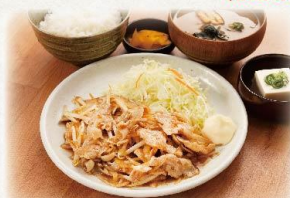
豚バラのしょうが焼き定食

980 円(税抜:891円) とんかつ&エビフライ定食 1,090 円(税抜:991円)