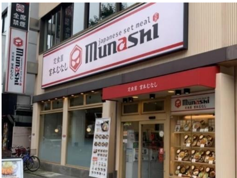
定食屋宮本むなし 店舗外観

看板メニューは「自家製タルタルのチキン南蛮定食」。アツアツ揚げたての鶏もも肉に甘酸っぱい南蛮酢を絡めて旨味を染み込ませ、毎日お店で丹念に手作りしている自家製タルタルソースで仕上げます。バラエティ豊かな定食メニューとごはんおかわり自由で、おなか一杯の幸せを提供します。