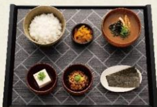
納豆朝食 390円 (税抜:355円)