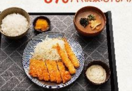
サクサク鶏むね肉の 子キン南蛮とエビフライ定食