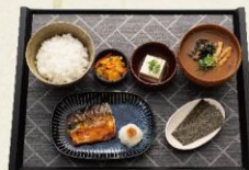
サバの塩焼き朝食 490円 (税抜:446円)