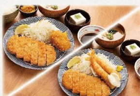
とんかつ&カニクリームコロッケ定食

(並盛) 790 円(大盛) 1,000 円 (税抜:719円) (税抜:910円)