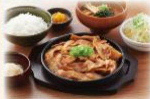
鉄板!豚の生姜焼き定食

(並盛) 820円 (大盛) 1,050円 (税抜:746円) (税抜:955円)