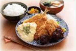
豪華!アジフライ&ヒレカツ定食