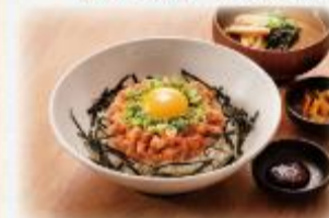
ねぎとろユッケ丼