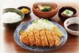
三元豚ロースとんかつ定食

とんかつ 890円 お好みソース 990円 (税抜:810円) (税抜:900円)