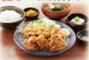
鶏もも肉の唐揚げ定食

990円 (肉大盛) 1,350円 (肉大盛) 1,690円 (税抜:900円) (税抜:1,228円) (税抜:1,537円)