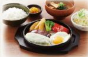
特製デミのチーズハンバーグ定食

(並盛) 820円 (大盛) 1,050円 (税抜:746円) (税抜:955円)