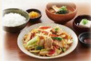
たっぶり肉野菜炒め定食