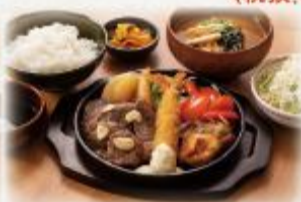
牛カットステーキミックス定食

とんかつ 890円 お好みソース 990円 (税抜:810円) (税抜:900円)