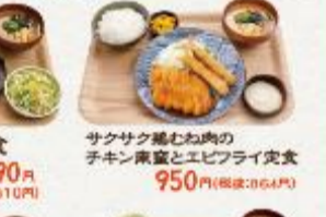
サクサク鶏むね肉の子キン南蛮とエビフライ定食

(並盛) 1,020円 (特盛) 1,630円 (税抜:929円) (税抜:1,482円)