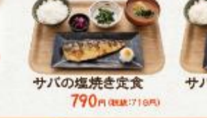
サバの塩焼き定食