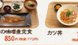
サバの味噌煮定食