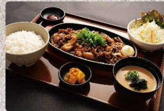
焼肉ミックス(牛・豚・鶏)定食 980円 Yakiniku MIX set (税込1078円)