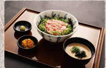
ねぎとろ丼 Chopped tuna and green onions on rice 790円(税込869円)