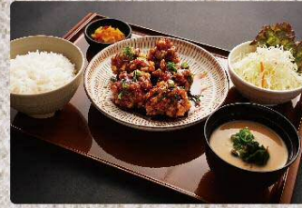
甘辛タレ唐揚げ定食 920円 Fried chicken with sweet and spicy sauce set (税込1012円)