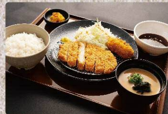
とんかつ&カニクリームコロッケ定食 980円 Pork cutlet and crab cream croquette set (税込1078円)