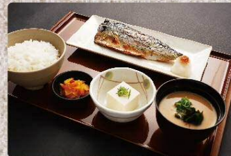
鯖の塩焼き定食 950円 Salt-grilled mackerel set (税込1045円)