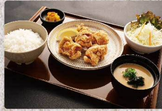
鶏の唐揚げ定食 890円 Deep-fried chicken thigh set (税込979円)