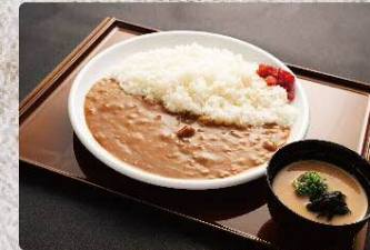
ビーフカレー Beef curry 650円(税込715円) カツカレー Cutlet curry 850円(税込935円) 野菜カレー Vegetable curry 830円(税込913円)