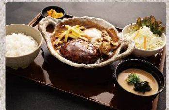
土鍋煮込みハンバーグ定食 990円 Clay pot demi-glace stewed hamburger set (税込1089円)