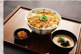
かつ丼 Pork cutlet on rice 790円(税込869円)