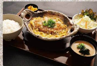
土鍋かつ煮定食 950円 Clay pot pork cutlet set meal (税込1045円)