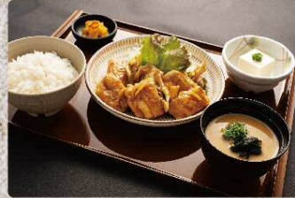
鶏と舞茸の柚子味噌焼き定食 950円 Chicken and Maitake mushrooms grilled with yuzu miso set (税込1045円)