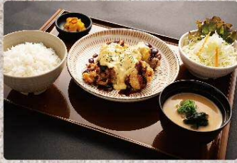
タルタル南蛮定食 890円 Chicken nanban with tartar set (税込979円)

これらのメニューおよび売価は定食屋宮本むなし新今宮店限定です。他の宮本むなしでは販売しておりません。 売り切れ等により予告なく販売中止になる場合がございます。詳しくは店内の注文用タブレットでご確認下さい。