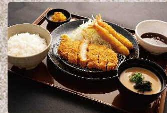
とんかつ&エビフライ定食 1090円 Pork cutlet and fried shrimp set (税込1199円)