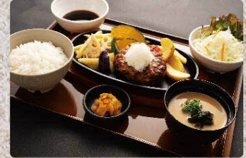
おろしポン酢ハンバーグ定食 920円 Hamburg steak with radish soy sauce set (税込1012円)