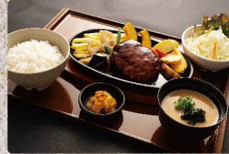
特製デミグラスソースのハンバーグ定食 920円 Hamburg steak with cheese and demi set (税込1012円)