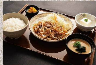
豚バラのしょうが焼き定食 820円 Grilled ginger pork belly set (税込902円)