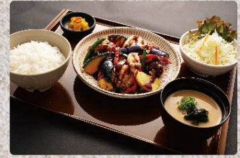
鶏と野菜の黒酢あん定食 950円 Vinegared vegetables and chicken set (税込1045円)