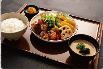
鶏の唐揚げと温野菜の香味葱たれ定食 950円 Deep fried chicken and steamed vegetables with aromatic scallion sauce set (税込1045円)