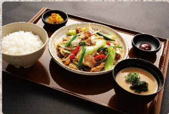
たっぷり肉野菜炒め定食 820円 Stir-fried meat and vegetable set (税込902円)